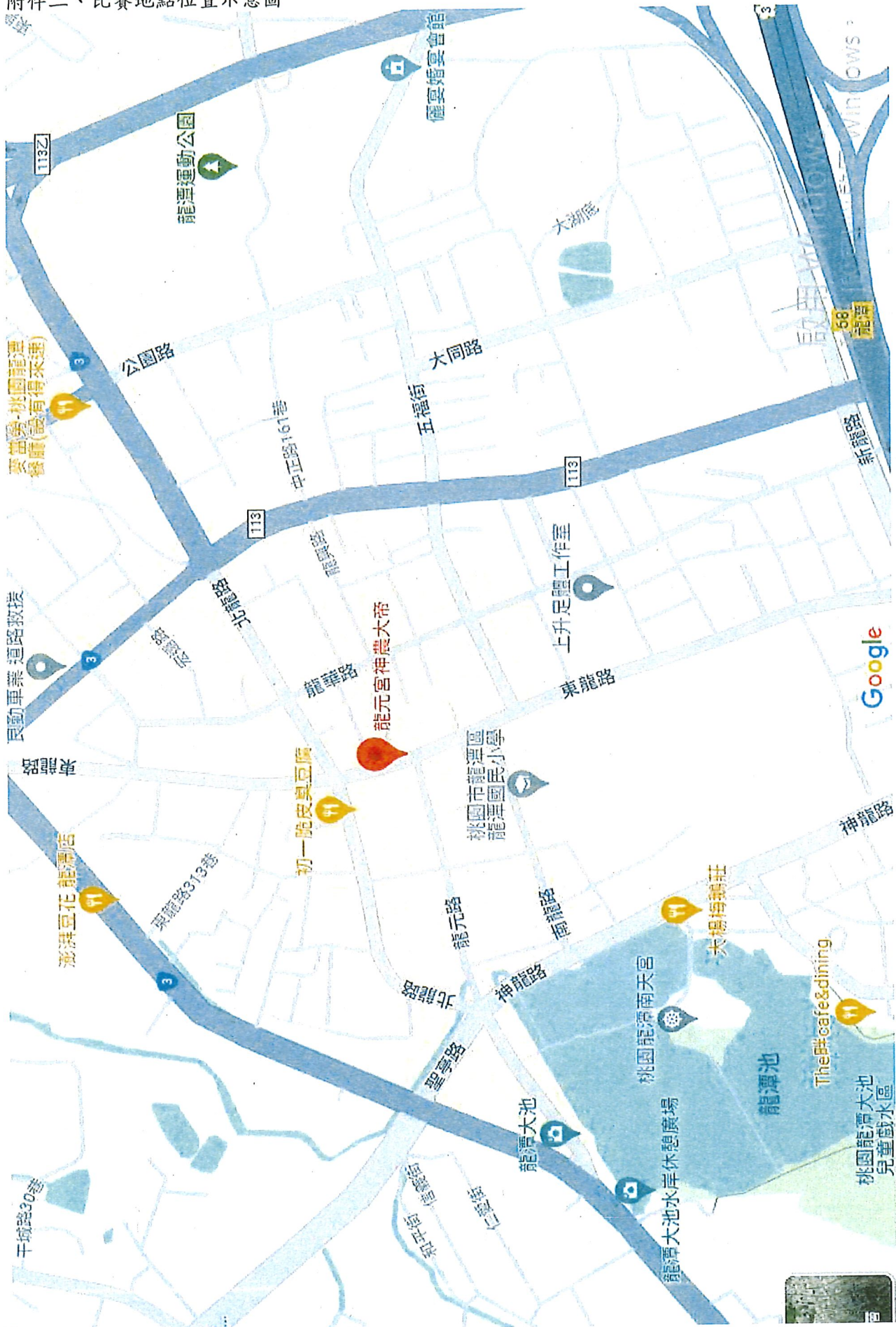
附件二、比賽地點位置示意圖